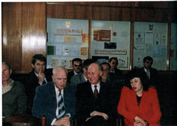
Во время обсуждения диссертации