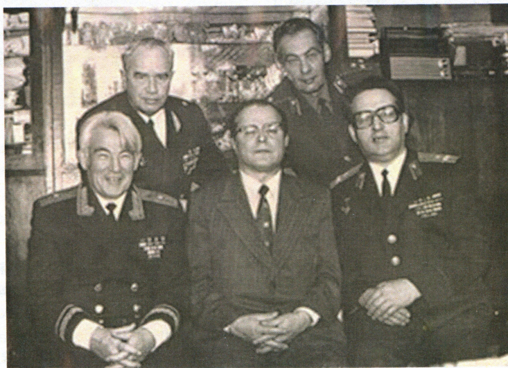
Вместе с коллегами